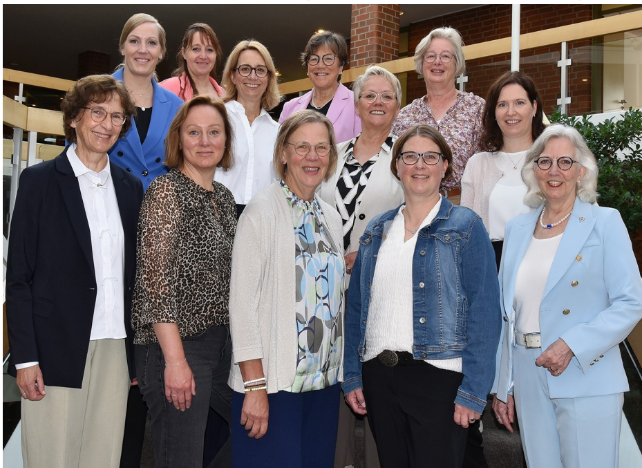
Foto zeigt Vorstand und hauptamtliche Mitarbeiterinnen von donum vitae Emsland

und Würdigen der geleisteten Beratungsarbeit eröffnete einen Raum für Vertrauen und Zuversicht in die kommenden Jahrzehnte. Die Feierstunde bildete den Abschluss von verschiedenen Auseinandersetzungen mit der Geschichte von donum vitae Emsland und der Schwangerschaftsberatung. Weiteres zu den einzelnen Aktionen finden Sie im Einleger des Jahresberichtes.